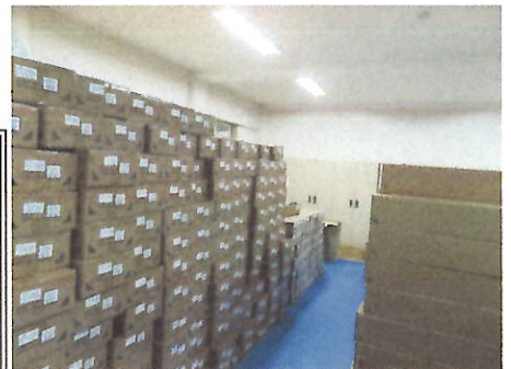
【運び込まれたLED照明】

工事は次のとおり進められます。深夜の工事となります。異常な状態ではありません。何とぞよろしくお願いいたします。