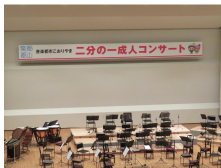
【演奏中の撮影は禁止となっていますので始まる前にパチリ】