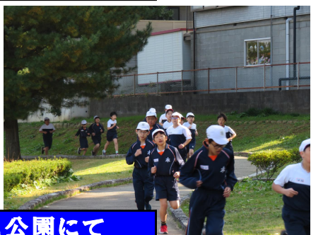
高学年 11月14日(木) 荒池公園にて