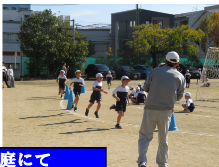
低学年 11月12日(火) 校庭にて