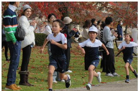
中学年 11月13日(水) 荒池公園にて