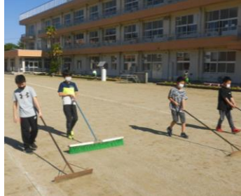
運動委員会の朝の活動