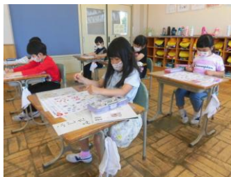
左：1年生 右：2年生 年生 テストにチャレンジ！ 1年生は、初めての本格的なテストへのチャレンジです。