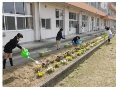
美化委員会の朝の活動