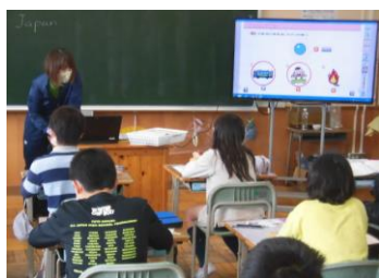
6年生外国語科にチャレンジ！