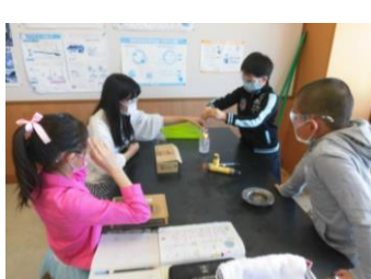
6年生理科実験にチャレンジ！