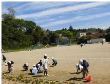
美化委員会と運動委員会の子どもたちの除草活動

※「無休」以外の電話相談窓口は、土・日曜日、祝日、年末年始は休みとなります。 ※ 郡山市ニコニコこども館の休館日は、毎月第3土曜日とその翌日、12月29日~1月3日です。