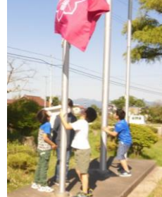
集会委員会の朝の活動

上学年の子どもたちが、委員会活動に意欲的に取り組む姿が見られました。今年度は奉仕作業をすることができませんでしたが、子どもも教職員も一丸となってきれいな環境づくりに努めています。子どもたちは、整えられている環境のもとで、運動したり遊んだりすることができます。(上記以外の委員会の活動については、別の機会にお伝えします)