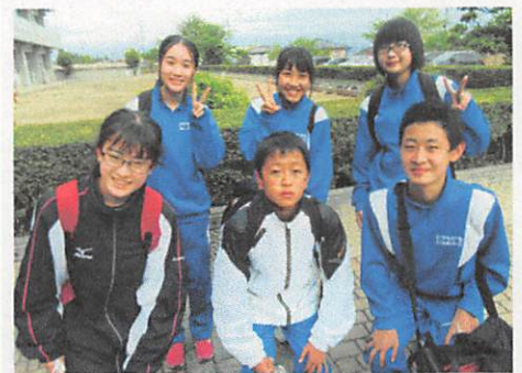
[陸上大会、頑張りました◎]