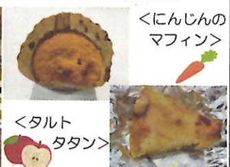
<にんじんのマフィン>