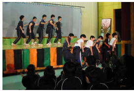
ダンス発表 3年男子