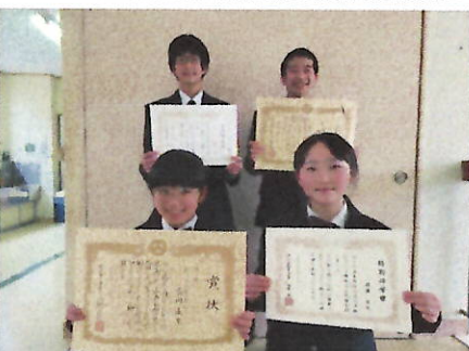
<1年間本当にお世話になりました。私たちも立派な2年生になります！>