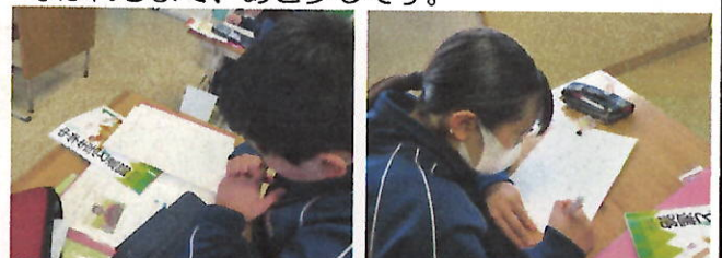
<総合で、65歳までの人生設計を考えました>

2回目の実力テストは、その人によって受け止め方・感じ方はさまざまだったようです。意外と点数が取れた教科があったり、思うように伸びなかった教科もあったりと、なかなかうまくいかないものですね。各教科の先生方が模擬採点をしていたのをのぞかせてもらいました。テスト後に一度お話ししましたが、記号しか当たっていない英語や数学はちょっと残念かな・・・。書く力が相当足りないことは、体育専門の私でも一目見てよくわかりました。ここでもう一度、学習の取り組み方について見直す必要があります。