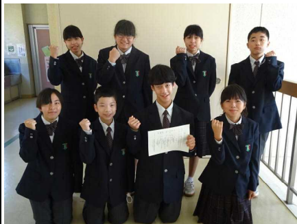
<寸劇部門のみなさん>

僕たちの寸劇は、魔法使いになりたい生徒たちが通っている御館魔法学校で、毎日呪文を唱えながらドタバタしている様子を演じます。なぜか毎回呪文は失敗するのですが、新しく唱える呪文は果たして成功するのでしょうか?お楽しみに!!