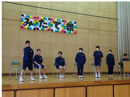
<立ち稽古の様子です>