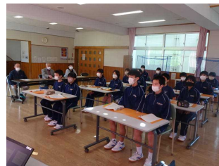
<この舞台を盛り上げるために、真剣にお話を聞きました!!>