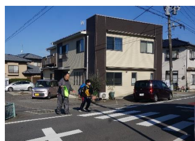
大橋付近の交差点