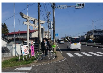
隠津島神社前の交差点