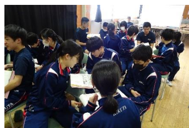
情報モラル教室の様子