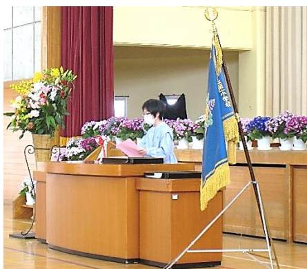
↑入学式 6年代表児童による歓迎の言葉

式の最後には、今年度本校に転入された3人のお友達を紹介しました。異動やクラス編成で新しい先生方や新しい友達との出会いなどもあったことと思います。早くなかよしになって、楽しい学校生活を送ってほしいと願っています。