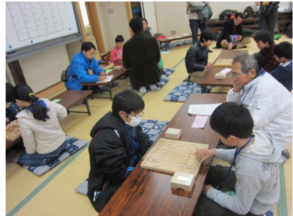
【オセロ・将棋大会】

2月12日(木)、6年生から5年生へ鼓笛が引き継がれました。大槻小の伝統のバトンタッチです。多くの保護者の皆さまの応援、ありがとうございました。