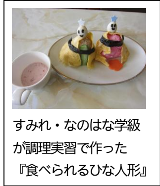
すみれ・なのはな学級が調理実習で作った『食べられるひな人形』