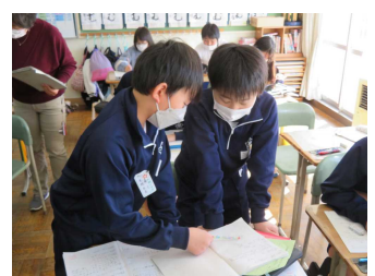
各学年・学級の研究授業