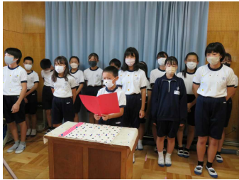
合奏・陸上壮行会(9/28)