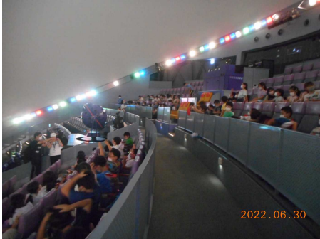
【プラネタリウムで「宇宙への旅」】