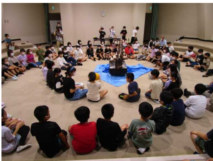
【夜は幻想的なキャンドルファイヤー】