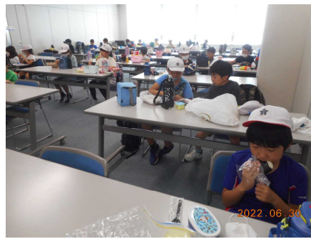
【昼食はふれあい科学館にて】