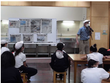
【自然の家到着後、教頭先生からの講話】