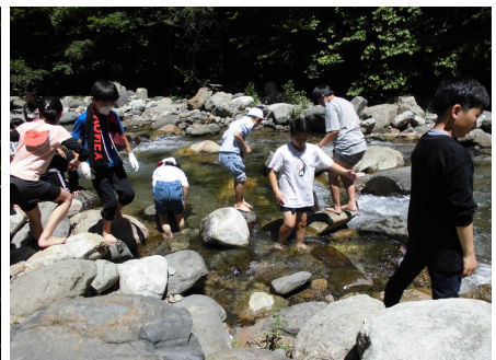
【阿武隈川の源流で水遊び！】