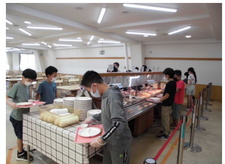
【食事は自然の家でのバイキング】