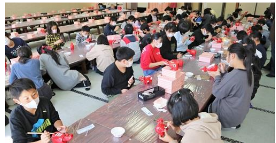
<赤べこの絵付け体験活動>

詳細は、6年生の学校通信でお知らせされると思いますので、ここでは、子どもたちの楽しい雰囲気分かるようなものを紹介します。