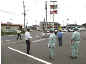
【南長久保セブンイレブン前道路】

7月30日(火)午後、県中建設事務所、市道路維持課、市民安全課、市教育委員会、学校、交通安全安積三小母の会で危険な通学路5カ所の合同点検を行いました。