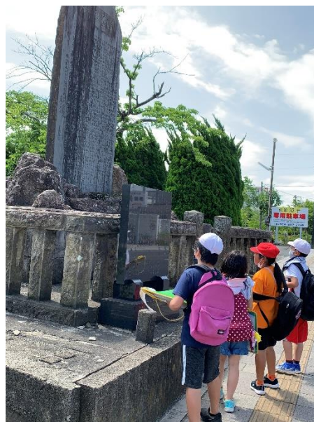
なんて書いてあるのかなあと真剣な表情で見っていました。