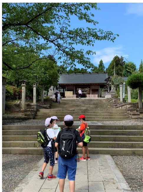
開成山大神宮の周辺には、銅像や石碑がたくさんありました。

様々なチェックポイントを探しながら、クイズにも挑戦してこんなところに石碑があったんだ、この公園はそういう意味があったんだと、新しい発見が多く、充実した学習ができました。学校に戻ると、さっそくクイズの答え合わせをして、正解だと「イエーイ！」と大歓声があがりました。その後は、新聞作りに取り組みました。廊下に掲示してありますので、教育相談の際、ぜひご覧ください。