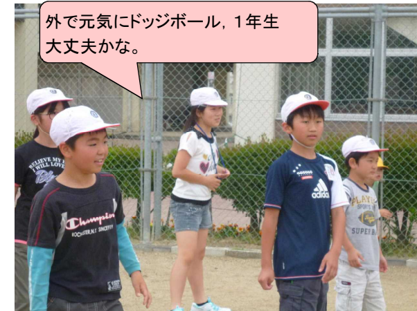
外で元気にドッジボール、1年生 大丈夫かな。