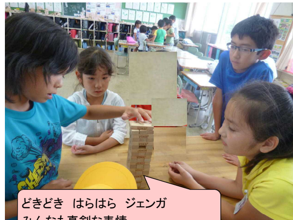
どきどき はらはら ジェンガ みんなも真剣な表情。

今年、15日に実施される60周年記念全校遠足でも一緒に活動します。4年生も活躍してくれることと期待しています。