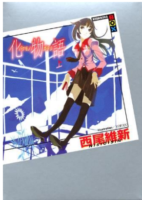
にしお いしん 西尾維新 著

5月増刊号から図書委員のおすすめ本の紹介がスタートします。 ぜひ読んでみて下さい！