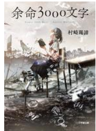
むらさき ぎやてい 村崎羯諦 著