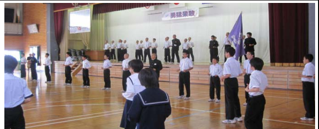
市中体連総合大会壮行会のための応援練習にも熱が入っています。