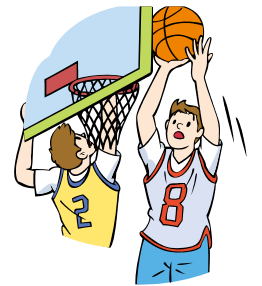
バスケットボール部男子

僕たちは、1回戦郡山二中と戦います。初めて1年生だけの大会なので、チームワークを大切にして、一人一人が最後まで諦めずに、全力でプレーしてきたいと思います。