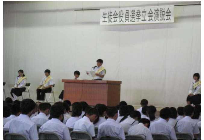
生徒会選挙演説会が行われました。

来週、24日、25日の2日間にわたり市中体連新人総合大会が行われます。新人チームになってからの最大の大会であるので、各部とも熱く気合いの入った練習を行っています。選手として大会に参加する人もいますが、1年生のみなさんの多くは、応援という形で大会に参加するのだと思います。応援は、選手みなさんを勇気づけてくれます。応援が、素晴らしいプレーを引き出してくれます。試合に集中し、選手と一緒に戦っている気持ちで応援できたら、今後の部活動への取り組みがより充実したものになります。真剣に試合にのぞむ先輩の姿を目に焼き付けてください。勝利を目指して、部員が一つになって真剣に戦う経験は、財産になるでしょう。今しかできない経験をしてください。