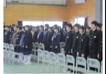
卒業式の練習にも真剣さが増しています。