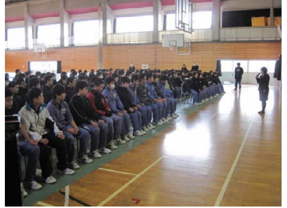
卒業式練習がはじまりました。

卒業まで1ヶ月あまりとなりました。昨日から卒業式の練習もはじまり、徐々に卒業への実感がわいてくると思います。最高の卒業式をつくり上げていきたいですね。県立Ⅰ期の内定がきまり、進路を決定した人たちが、学年全体の3分の1ほどになりました。これから受験の人たちは、焦りを感じることもあるかもしれませんが、3分の2以上の人たちは、これからが本番です。一日一日を大切に、粘り強く、一步一步希望進路実現に向けて進んでいきましょう。