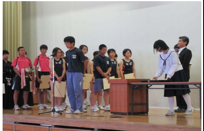
市中体連陸上大会・市中体連総合大会 受賞報告式