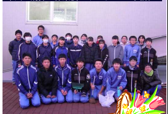
本気の清掃と作業後のみんな“いい笑顔”