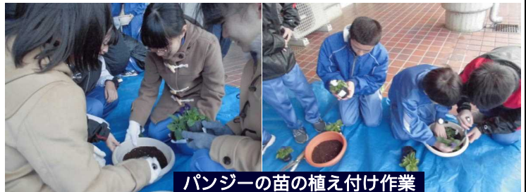
パンジーの苗の植え付け作業

この活動も毎年行っている本校の伝統ある活動です。“地域があってこそその学校”そんな感謝の気持ちを込めて…。学校と地域を繋ぐ一助になればと願います。