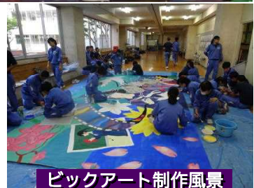
ビックアート制作風景