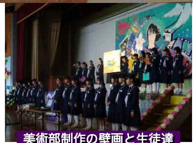
美術部制作の壁画と生徒達