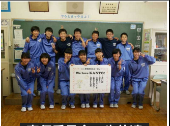
実行委員会の生徒達

今回の修学旅行のしおりにも工夫がありました。表紙を男子用と女子用の2種類に分けて作成したこと、そして表紙と裏表紙のイラストやデザインが完成度の高い素晴らしいものであることなどです。