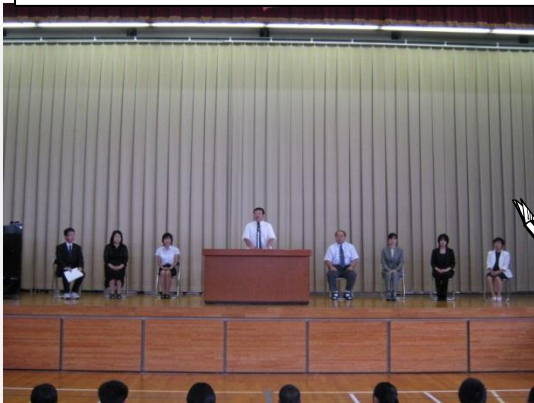
教頭先生による新しい先生方の紹介