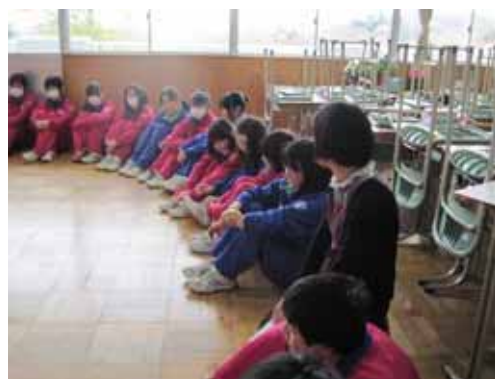
「心のケア」の授業から

どうですか？どのくらいできていますか？どの項目も大切です。自分をチェックし、向上できるようにしたいものですね。