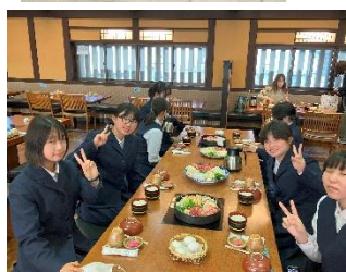
【夕食】素晴らしい食事でした