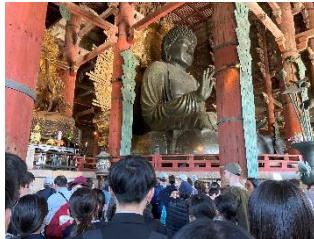
【東大寺大仏殿】すごく大きかった大仏様!