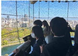
【大阪城】 素晴らしかった天守閣からの景色