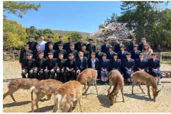
《奈良公園・薬師寺にて》