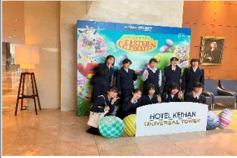
【京阪ホテル】 疲れをいやしました