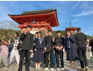
【清水寺】仁王門で。外国人旅行者の方の多さにびっくり。