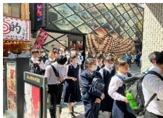
【グランド花月】 笑って、笑って、面白かった