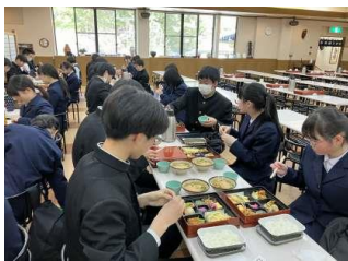
【昼食】奈良公園近くで昼食タイム。