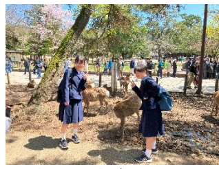
【奈良公園】鹿が多かった。せんべいは、すぐになくなりました。