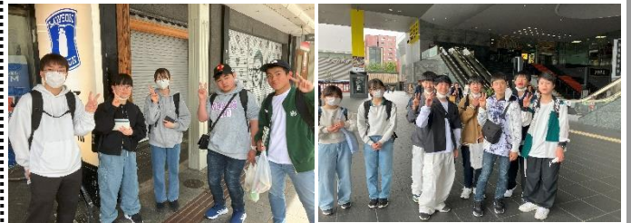
【班別研修四条河原町】