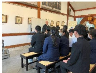
【薬師寺】和尚さんから法話を聞く。ためになるお話でした。