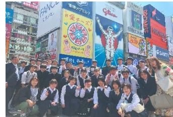
《大阪城・海遊館・戎橋にて》