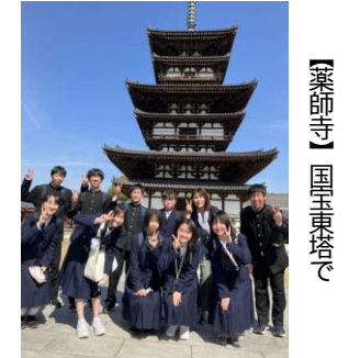
【薬師寺】国柱東塔で