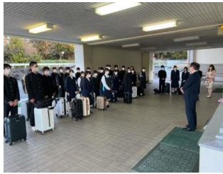
【出発式】元気にあいさつ。