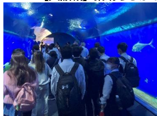
【海遊館】 大きかったジンベイザメ