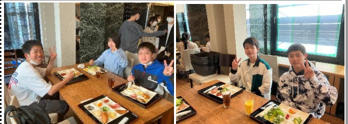
【リノホテル京都】朝早いですが、いただきます