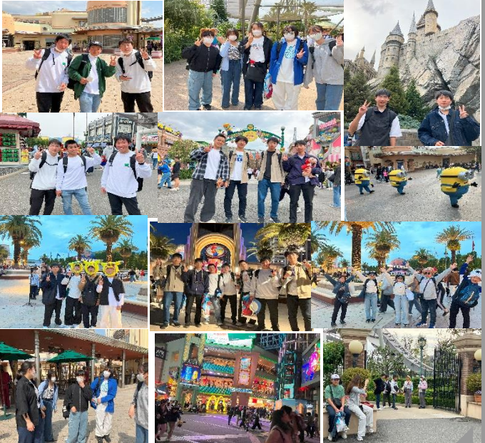
これから伏見稲荷へ向かう班