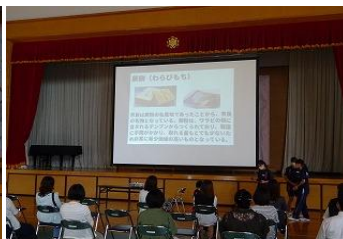
3 学年「総合（修学旅行事前学習学年発表）」