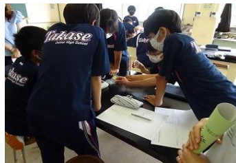
1 学年「理科（身のまわりの物質）」