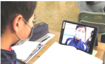
【カメラ機能を活用したプレゼン練習】