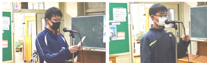
【船木生徒会副会長】