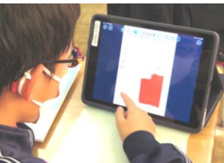
【ベラベラシート個別学習】