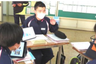
【グループでのプレゼンテーション】