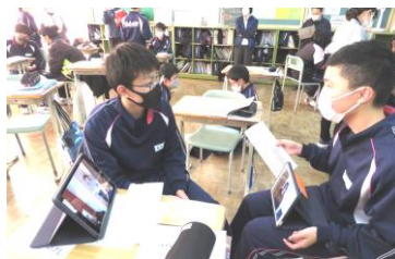
【ペアでのプレゼンテーション】