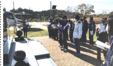
【双葉・浪江町内フィールドワーク】