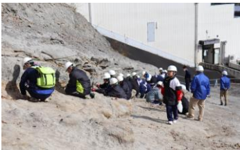
【アンモナイトセンター発掘体験】

いわき市アンモナイトセンター(発掘体験) / Jヴィレッジ(昼食) / 東日本大震災原子力災害伝承館