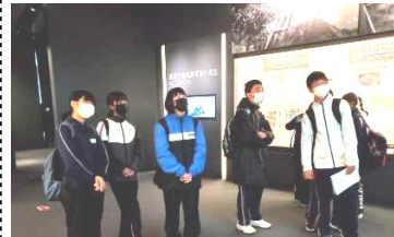
【東日本大震災原子力災害伝承館】

東日本大震災原子力災害伝承館 / いわきららみゅう(昼食) / アクアマリンふくしま