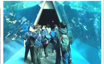
【アクアマリンふくしま】