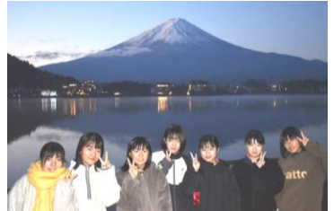
【早朝の山中湖畔】逆さ富士(左)と朝の散策(右)