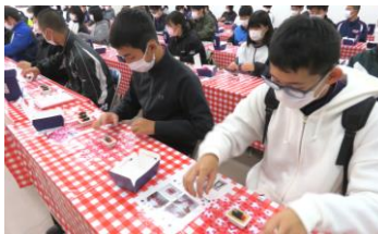
【桔梗信玄餅テーマパーク(包装体験/工場見学)】