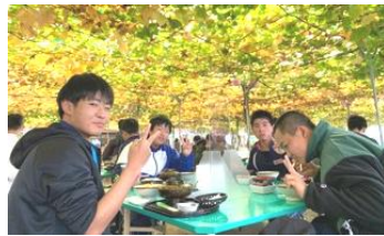
【御坂農園グレープハウス】ぶどう棚の下で昼食