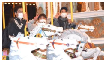
【富士急ハイランド】