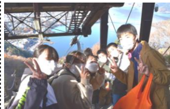
【富士山パノラマロープウェイ】