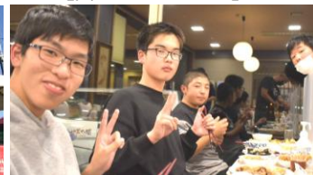
【富士ノ湖ホテル夕食】