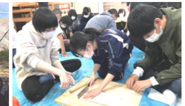
【ほうとう作り:写真上・下左右】