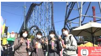
【富士急ハイランド】