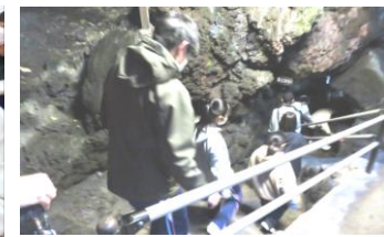
【富岳風穴・鳴沢氷穴ガイドツアー】