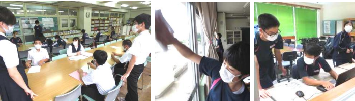
【図書委員会】 【ボランティア委員会】 【生徒会新聞作成】

9日に生徒会専門委員会が行われ、エコキャップや一斉歯磨き等、各専門委員会におけるSDGsの取組について、今学期の反省と2学期の課題について話し合われました。