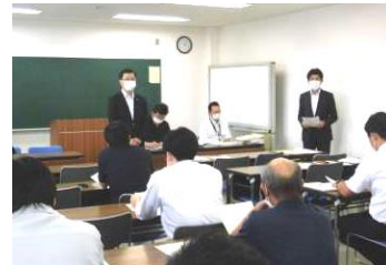
(郡山中央工業団地会訪問)

今年度、高瀬小中学校運営協議会の委員の皆様のお力添えを得て、地元高瀬地区の職場を紹介していただくこととなりました。