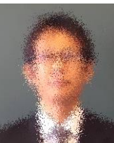
2年2組担任/ 英語/生徒会 目黒

高瀬中学校5年目になります。今年度も数学、バレーボール部を担当します。高瀬中の生徒の皆さんが安心して楽しく充実した学校生活を送れるよう精一杯サポートさせていただきます。