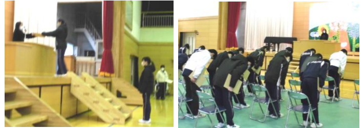
〔卒業式の練習の様子〕