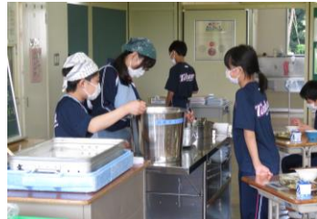
【1の1給食配膳の様子】