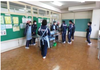
【3の2給食配膳の様子】

今週、全国すべて都道府県の非常事態宣言が解除され、「新しい生活様式」のもと社会生活が動き始めました。本校でも、学校における「新しい生活様式」に基づき、生徒の健康安全を最優先に、通常の教育活動を再開していきます。