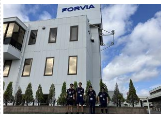
【クラリオン郡山事業所】