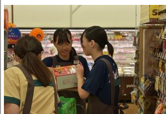
【ヨークベニマル金屋店】