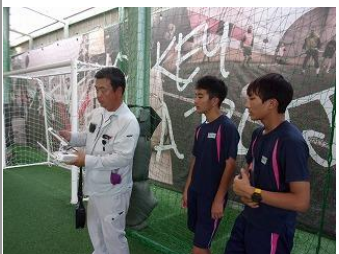
【郡山産業機械講習所】