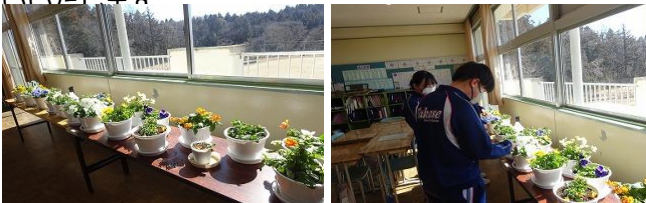
卒業式を彩るパンジーも大きくなりました