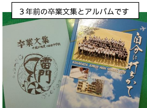
3年前の卒業文集とアルバムです