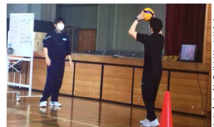
←実習授業の様子(手前)