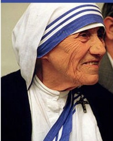
マザー・テレサ (Mother Teresa) (1910-1997)