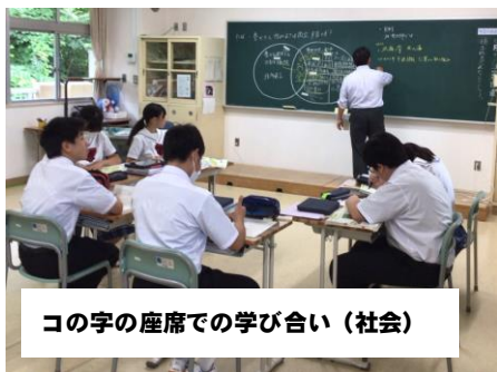
コの字の座席での学び合い（社会）