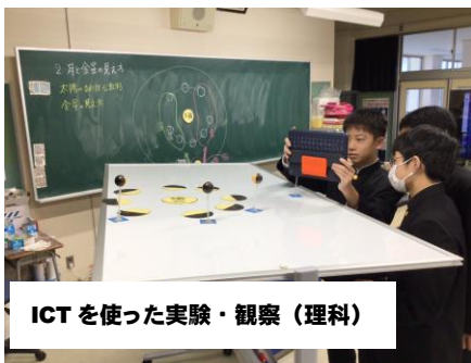
ICTを使った実験・観察（理科）