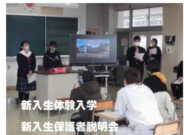
新入生体験入学 新入生保護者説明会