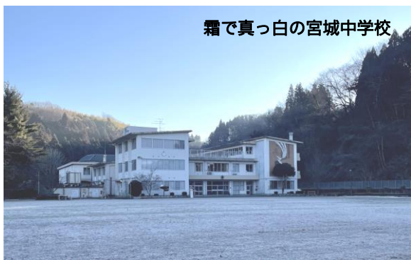
霜で真っ白の宮城中学校

「如月（きさらぎ）」の名前の由来は、まだまだ寒さが厳しい時期のために、更に衣を重ね着するという意味から「衣更着（きさらぎ）」になったという説があります。今週は二十四節気の一つ大寒で、朝夕の冷え込みは一段と厳しく感じられましたが、来週以降も寒さは続く予報となっています。冬の寒さに加えて、学校では感染防止のための換気により、教室の温度も低くなりがちです。体の冷えは体調を崩す原因になりますので、学校では生徒に重ね着やひざ掛けの使用を推奨しております。生徒の学びと健康・安全の両立のため、ご理解とご協力をお願いいたします。