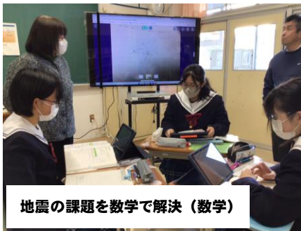
地震の課題を数学で解決（数学）