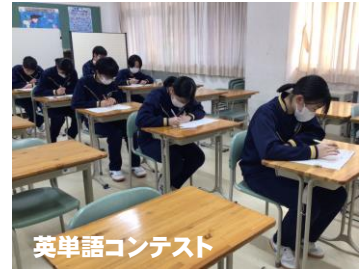
英単語コンテスト

今年度3回目のいじめ調査を実施しました。生徒一人一人の声にしっかりと耳を傾け、全ての生徒が安心して思う存分学ぶことができる学校づくりに努めてまいります。