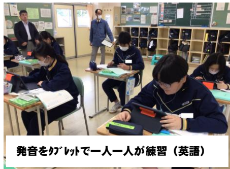
発音をタブレットで一人一人が練習（英語）