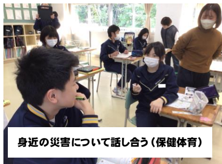
身近の災害について話し合う（保健体育）

各教科において、生徒に学習の見通しを持たせる手立てを講じたり、学力差や個の実態に応じた手立てを講じたりすることにより、学びの意義や価値を実感し、将来の夢や希望を意識した学習を行う生徒を増やすことができました。「チーム宮城中」の教職員は、これからも生徒の学力向上を目指し、日々研鑽に努めてまいります。