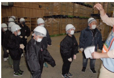
【-25度の保存庫。寒いー！】