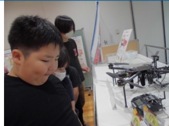
【災害時に活躍する様々な道具】