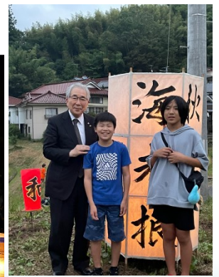
【市長さんと点灯式】