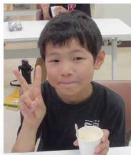
【アイスクリームをいただきました。】