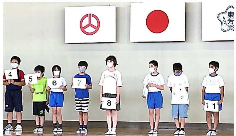
↑ 「あいさつコンテスト」の班長さんたち