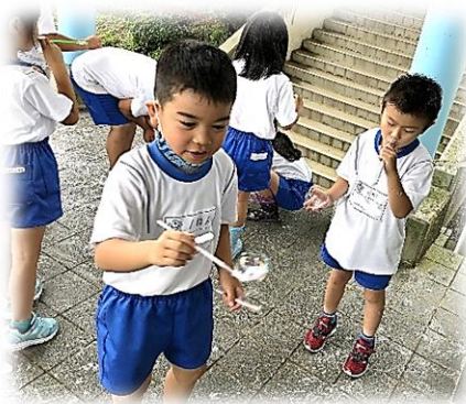
← しゃぼん玉遊び(1年)